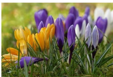
Brândușă dă primăvară